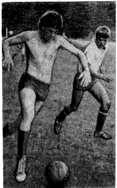
ВПЕРЕДИ — ПОБЕДА!