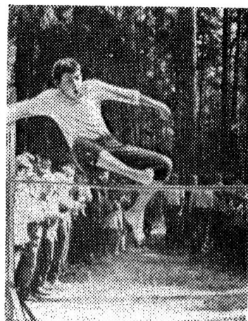
ЕЩЕ ОДНА ВЫСОТА