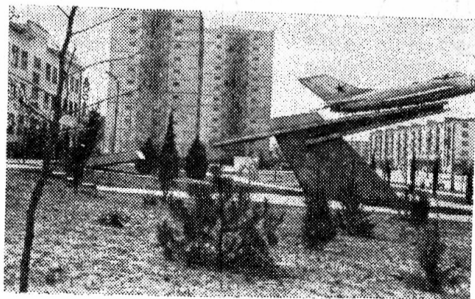
СЕВАСТОПОЛЬ. На улице имени Героя Советского Союза Н. А. Острякова.