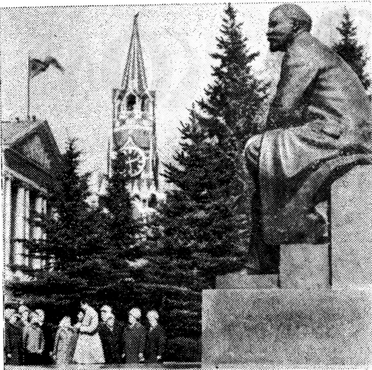
Москва. Памятник В. И. Ленину в Кремле.

Во всем мире В. И. Ленин — наиболее читаемый автор. На 125 языков переведены его труды. Общий тираж произведений Владимира Ильича, изданных только в нашей стране, приближается к полумиллиарду. По-ленински жить и бороться за счастливое будущее учатся трудящиеся всех континентов. И недавно найденные ленинские документы будут встречены с живейшим интересом миллионами и миллионами людей.