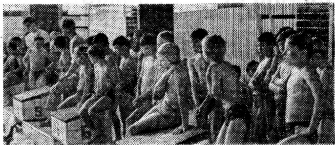
В ожидании старта.