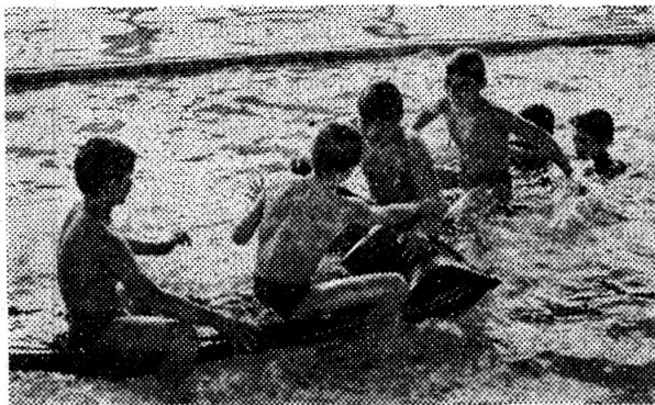
Идет «морской бой».