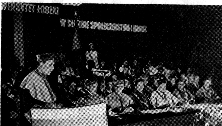
Директор ЛНФ ОИЯИ академик И. М. Франк выступает на торжественном заседании университета.