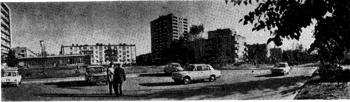
ЛЕТОМ В ДУБНЕ