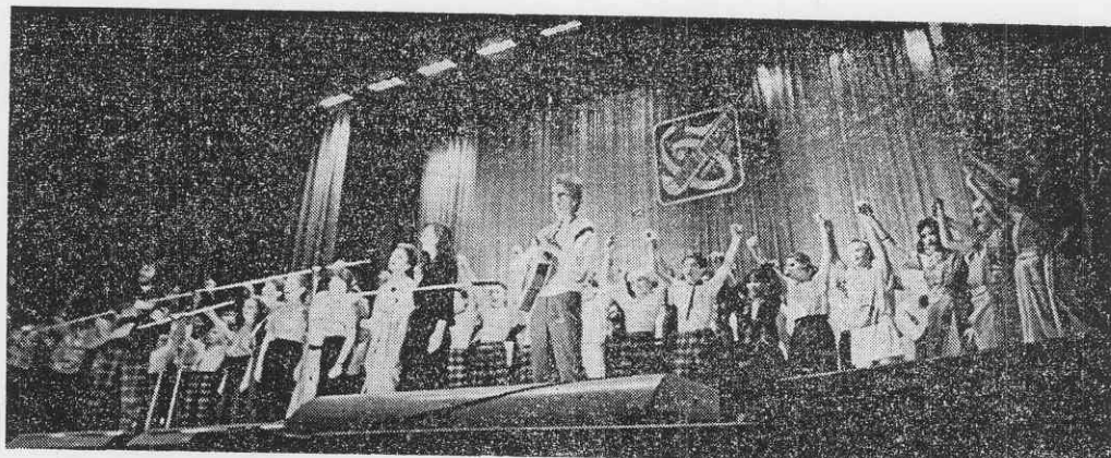
Финал концерта на сцене Дома культуры «Мир».

— Новосибирск — это первый в Советском Союзе фестиваль политической песни. Первый не по времени, а по своему значению. Именно там можно проследить не только историю развития этого движения в Советском Союзе, но и оценить его будущее. Мы поем вместе уже больше десяти лет. Побывали на разных фестивалях, конкурсах, в том числе и за рубежом, но все же такой мощный заряд не подуманного, а истинного патриотизма, интернационализма получили только в Новосибирске. Там чуж-