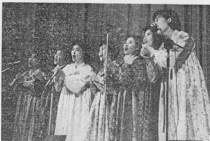
Никого не оставило равнодушным выступление корейских сотрудников — они исполнили melodичные песни на родном языке, нашу «Катюшу» и другие русские песни.