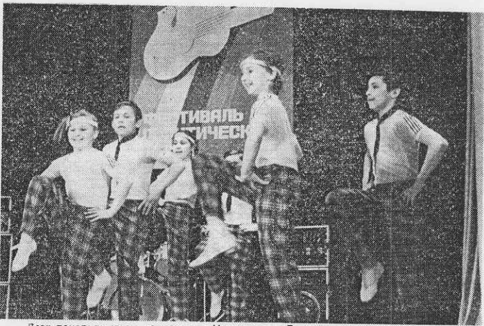
Всея покорили юные танцоры из Московского Дворца пионеров и школьников.