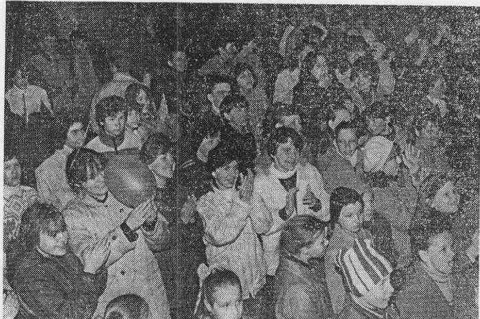
Полноправными участниками фестиваля были многочисленные зрители. Их голоса вплетались в общий хор повсюду, где проходили концерты и встречи.