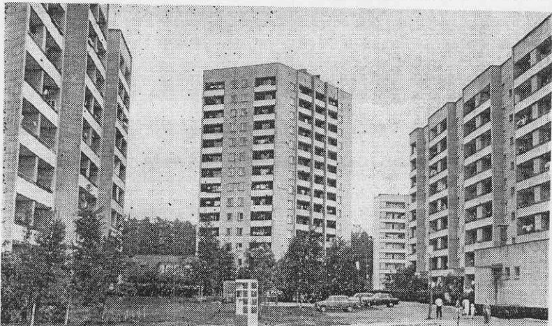
На улице Московской.