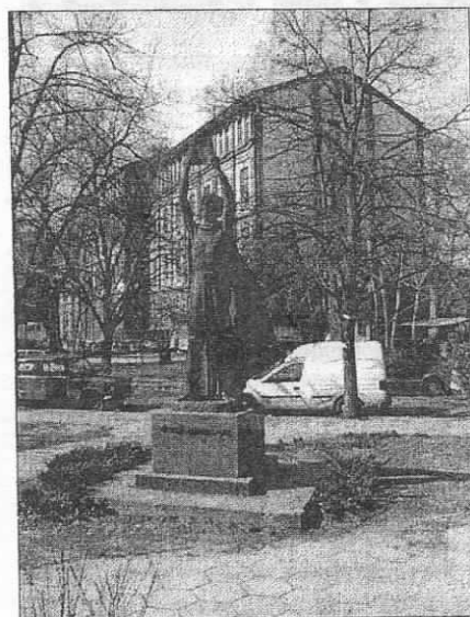
Пловдив. Здание университета.

Исключительные заслуги в укреплении научных связей Болгарии с ОИЯИ имеет наш соотечественник