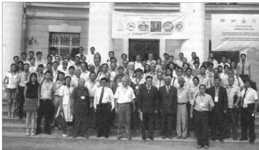
Участники Международной конференции по современной физике в Улан-Баторе.

С 13 по 20 августа в столице Монголии Улан-Баторе проходила ставшая уже традиционной Международная конференция по современной физике, организованная и спонсируемая Комиссией по ядерной энергии правительства Монголии, Национальным университетом Монголии, Монгольской Академией наук, Монгольским фондом науки и технологий, Университетом Улан-Батора и Объединенным институтом ядерных исследований.