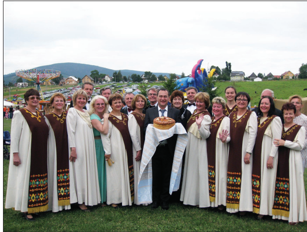
На Празднике урожая в Мутнэ. Встреча с мэром.