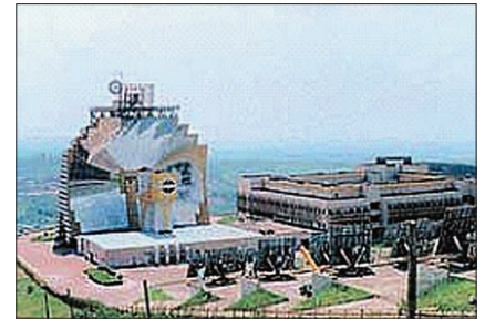
Уникальный научный объект – би-зеркальная оптико-энергетическая установка – солнечная печь мощностью 1 МВт, созданная в Институте материаловедения НПО «Физика – Солнце». Республика Узбекистан. Сегодня он стал базой для международного сотрудничества.

тов и сооружений; способствовать объединению усилий, направленных на подготовку научных кадров высшей квалификации и осуществление всестороннего обмена информацией.