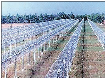
Крупнейший в мире радиотелескоп декаметровых волн УТР-2 Радиоастрономического института НАН Украины. Его используют для совместных исследований ученые Украины, России и других стран.

Важное направление деятельности МААН – участие в организации и проведении крупных международных симпозиумов, конференций, семинаров. В качестве примера можно привести пять международных семинаров для ученых и специалистов стран СНГ по вопросам охраны интеллектуальной собственности, которые прошли в 1996–2003 годах