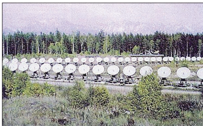
Сибирский солнечный радиотелескоп – один из научных объектов, где развивается сотрудничество ученых стран СНГ. С его помощью удалось получить уникальные научные результаты.

в Киеве на базе НАН Украины при финансовой поддержке Всемирной организации интеллектуальной собственности. В их работе принимали участие эксперты из Германии, Франции, Швейцарии и ряда других стран. По инициативе РАН, поддержанной ассоциацией, учрежден международный научный и общественно-политический ежемесячный журнал «Общество и экономика», который издается с мая 1998 года.