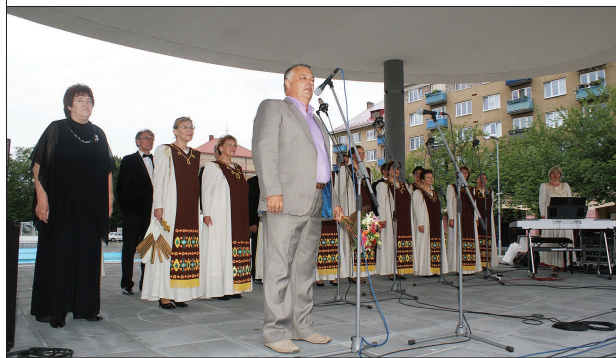
На главной площади Нова Дубницы.