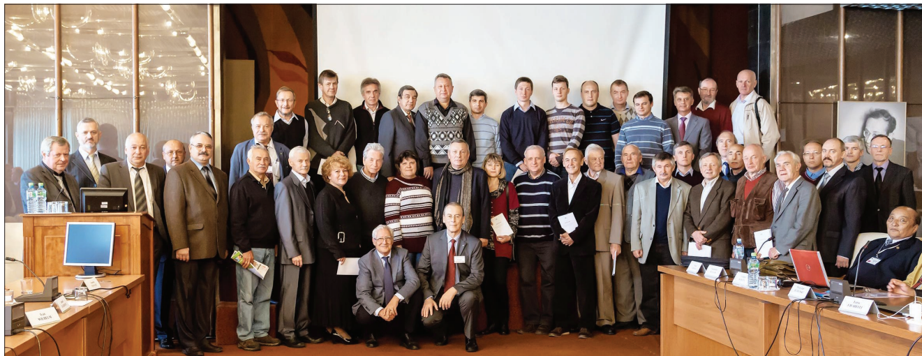
На снимке Елены ПУЗЫНИНОЙ: лауреаты премий ОИЯИ за 2012 год, которым на сессии были вручены дипломы.