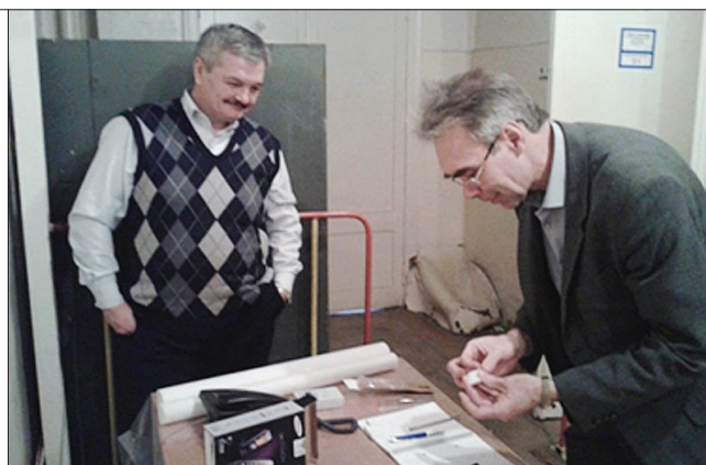
Измерение облученных образцов.