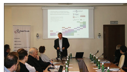
Занятие в рамках программы практического консалтинга.

11 ноября проведен мастер-класс для инвесторов, в центре внимания на котором – международная практика инвестирования в проекты и снижения рисков Seed Forum International Foundation. Здесь также проведены презентации проектов в формате инвестиционной сессии. Отдельное занятие было посвящено