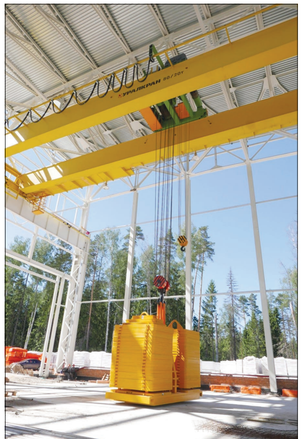
Статические испытания крана г/п 80 тонн. Вес контрольного груза 100 тонн.

Прямолинейность боковой поверхности базового рельса на длине 30 метров составила 0,17 мм. Второй показатель – неплоскостность верхней поверхности рельс на рабочей длине, где будет перемещаться наш магнитопровод, выполнена лучше чем 0,4 мм (разработчик магнитопровода НЕВА-МАГНИТ до-