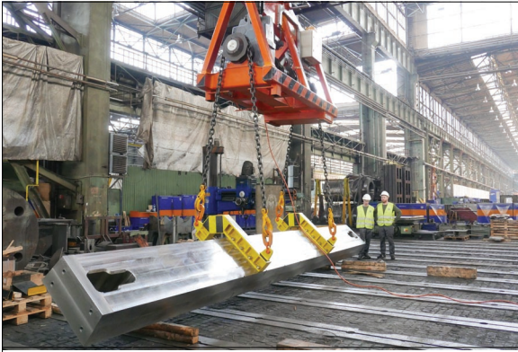
Манипулятор в работе. Подъем балки весом 16 тонн с поворотом для монтажа.