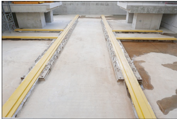
Рельсовые пути в прямой павильона MPD. Рабочие поверхности закрыты кожухами.

По результатам измерения карты магнитного поля возможна корректировка положения криостата относительно магнитопровода. Для этого опорные узлы под криостат спроектированы так, что позволяют зафиксировать криостат относительно магнитопровода с возможностью юстировки его положения плюс-минус 20 мм по трем осям. Для чего это делается? Магнитная ось криостата может не совпасть с его геометрической