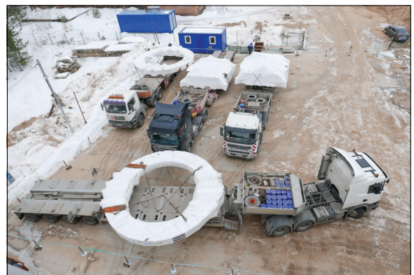
Два опорных кольца диаметром 6,7 м и два полюса в ЗВТК на территории ЛФВЭ.

При сборке магнитопровода успешно применялся манипулятор, который мы заблаговременно при-