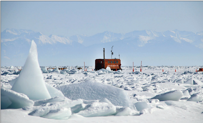
Ледяные торосы на озере Байкал, образовавшиеся из-за сильного ветра, сломавшего ледяной покров водоёма. За все 40 лет байкальских экспедиций исследователи столкнулись с таким явлением впервые.

Самые энергичные нейтрино наблюдаются такими современными нейтринными телескопами, как IceCube на Южном полюсе и детектор на Байкале (Baikal-GVD, основные научные организации – ОИЯИ и ИЯИ). Регулярно обнаруживаются частицы, несущие энергию в несколько петаэлектронвольт (1 ПэВ – единица с пятнадцатью нулями электронвольт). Откуда они приходят, до недавнего времени было неизвестно, и многочисленные поиски источников среди ярких объектов на небе или среди мощных вспышек не давали убедительного результата.