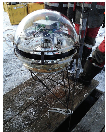
Оптический модуль, установленный на нейтринном телескопе Baikal-GVD.