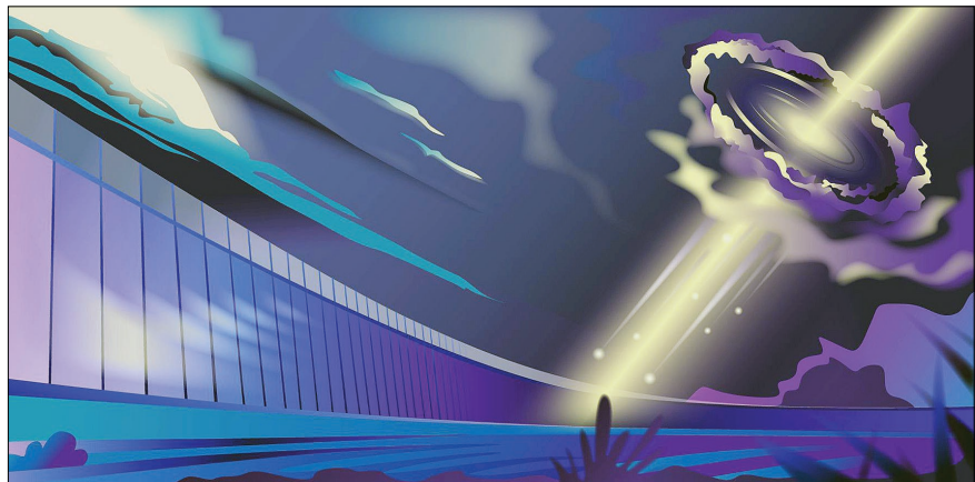
Телескоп РАТАН-600 помогает разобраться, где рождаются нейтрино. Иллюстрация Дарьи Сокол, пресс-служба МФТИ.

Читайте материалы на 3–5-й страницах газеты.