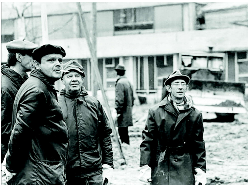
1974 год. На субботнике на строительстве реактора ИБР-2.