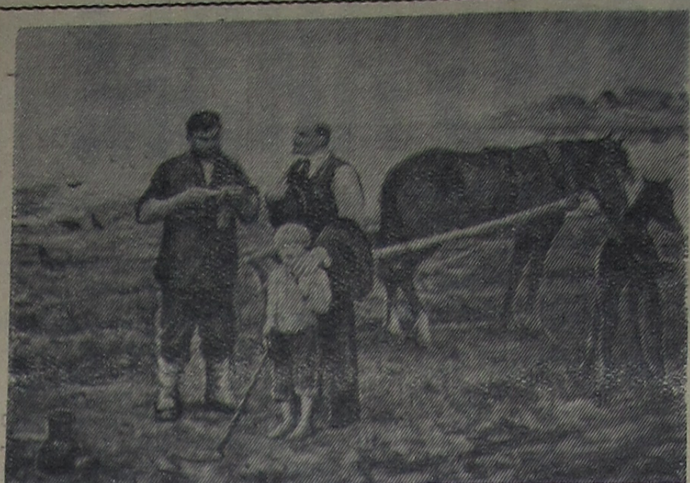
Картина художника П. Ф. Судакова «Разговор о земле».

Пленум принял решение, в котором предусматривается активное участие городской партийной организации в выполнении решения февральского Пленума ЦК КПСС.