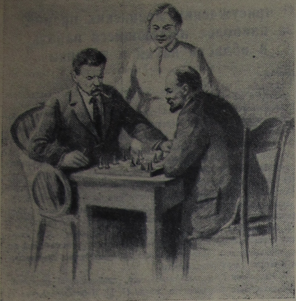
В. И. Ленин, А. М. Горький и Н. К. Крупская. Рисунок художника П. Васильева.