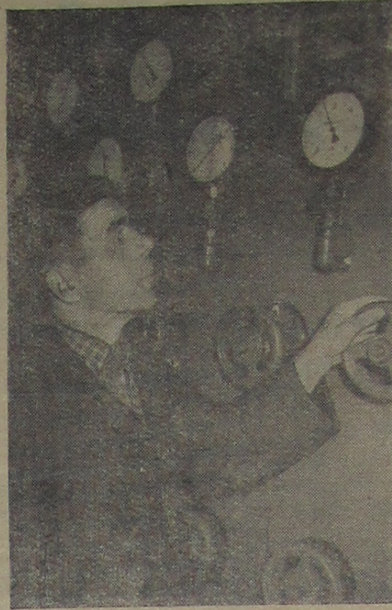
В цехе эксплуатации коммуникаций и водоснабжения.

Все это мешает коллективу прорабства выполнить обязательства, взятые ко Дню строителя.