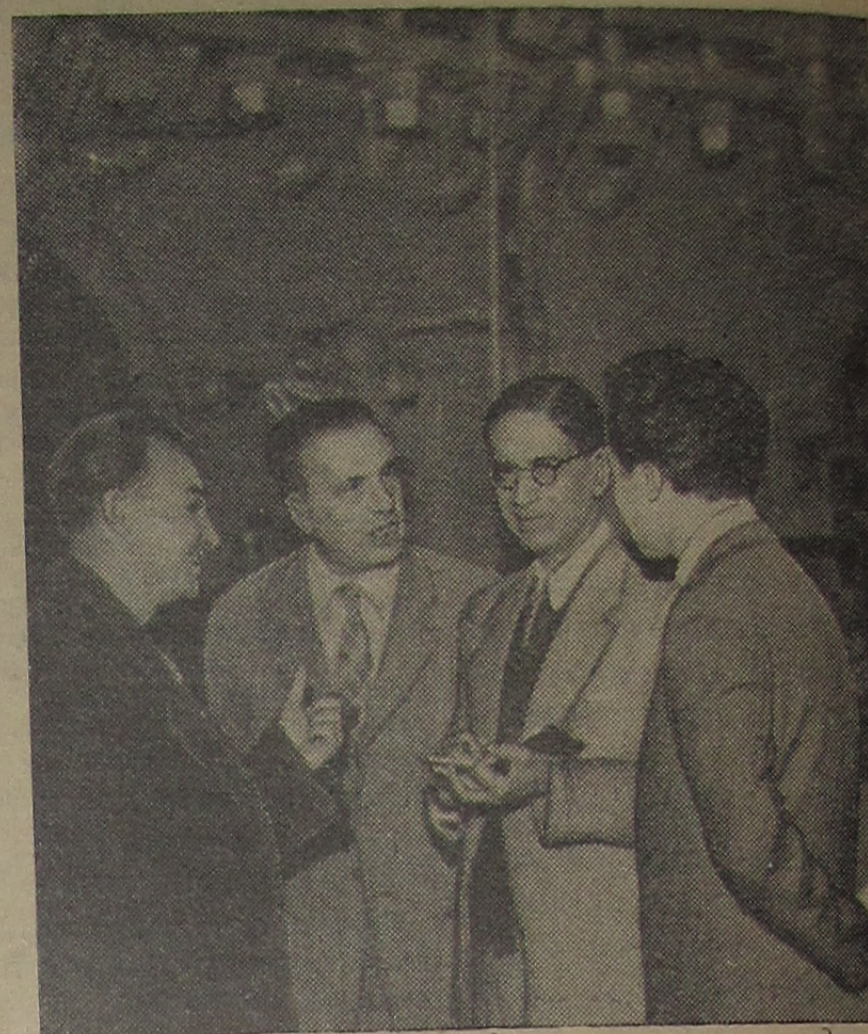
Недавно Объединенный институт ядерных исследований посетил известный индийский ученый профессор П. Ч. Махалонобис.

Хозяином НАТО являются Соединенные Штаты Америки. Под кабальные военно-политические и экономические обязательства они отпускают деньги своим младшим партнерам по агрессивным блокам. Один из таких американских должников — Турция. Обязательство, взятое правящими кругами Турции в уплату за американскую «помощь», трудное: осуществлять чуждые турецкому народу агрессивные планы империалистов. За долги Турция расплачивается не только своими дивизиями, аэродромами, портами, шоссевыми и железными дорогами, радиостанциями, отданными в распоряжение военного ведомства США. По сути дела американским империалистам проданы национальная независимость и суверенитет турецкого народа. В Совете НАТО турецкий делегат неравноправен с американским хозяином. Он может только признать продиктованные США