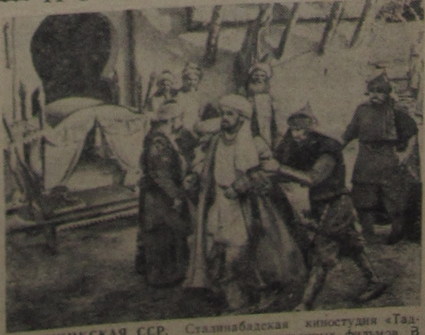
ТАДЖИКСКАЯ ССР. Сталинабадская киностудия «Таджикфильм» увеличивает выпуск художественных фильмов. В ближайшем времени будут выпущены на экраны кинофильмы «Судьба поэта» и «Человек меняет кожу» (первая серия). Начата съемка фильмов «Смысл пора жениться» и «Насреддин в Ходженте». На снимке: кадр из фильма «Насреддин в Ходженте».