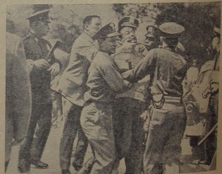
СОЕДИНЕННЫЕ ШТАТЫ АМЕРИКИ. Полиция разгоняет пикет бастующих работников нью-йоркских больниц.