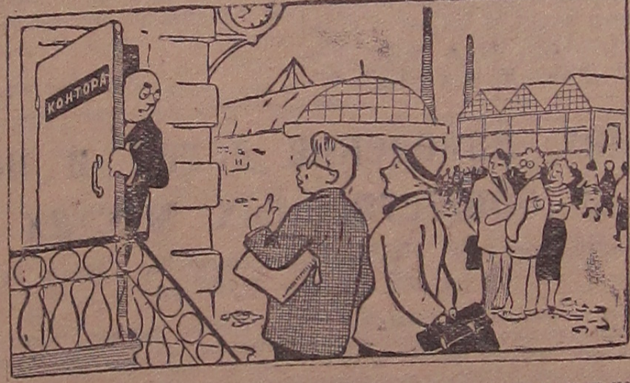
— Сегодня прямо на совещание идти или успеем еще в свои дела заглянуть? Рис. А. Цветкова.