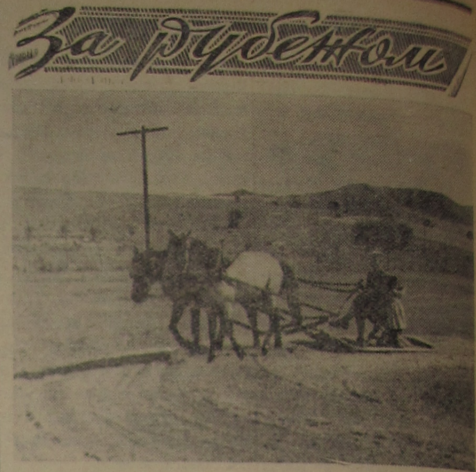
ТУРЦИЯ. Положение крестьян в стране исключительно тяжелое. По сведениям турецкой печати, 16,5 процента хозяйств земли не имеют. Медные крестьянские хозяйства составляют 69 процентов всех хозяйств, но в их владении находится только 28 процентов земель. Безземельные и малоземельные крестьяне принуждены арендовать землю у помещиков, которым принадлежит 7/10 всех обрабатываемых площадей.

На снимке: обмолот зерновых в деревне.