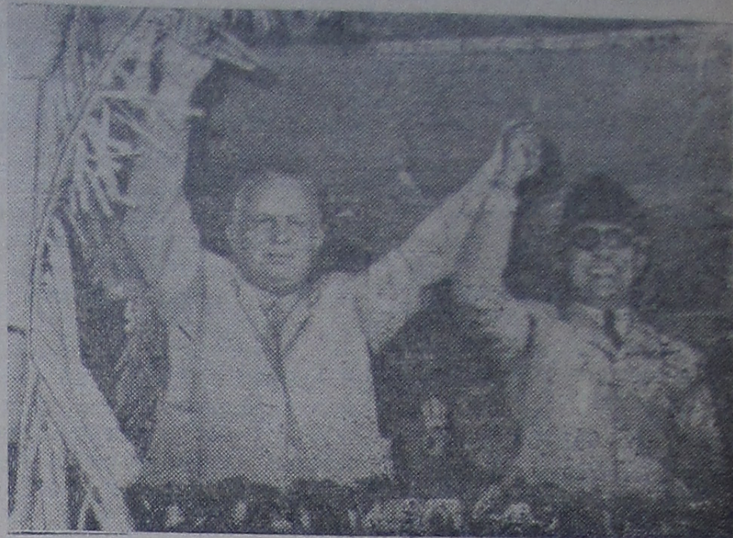
Индонезия. Председатель Совета Министров СССР Н. С. Хрущев и Президент Индонезийской Республики Сукарно во время митинга на стадионе в Сурбае.