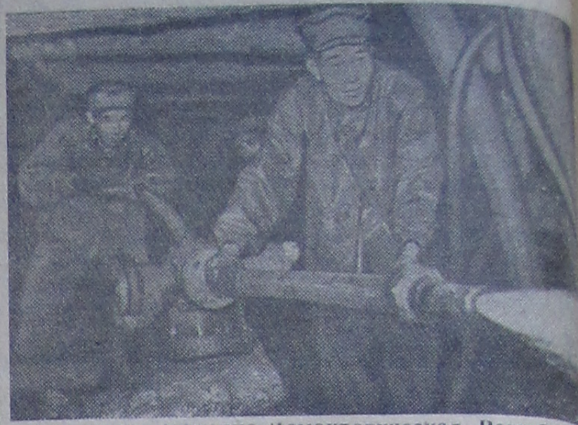
Корейская народно-демократическая Республика. Шахта Хенвон в провинции Южный Пхенан добыча осуществляется с помощью гидромониторов.

На снимке: гидродобыча угля на шахте.