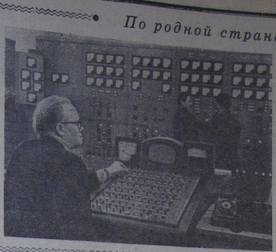
Исполнилось семь лет, как в Пермской области была поставлена под промышленную нагрузку первая агрегат Камской ГЭС — первенца среди гидроэлектростанций Камского каскада. За это время выработано около 11 миллиардов киловатт-часов дешевой электроэнергии.