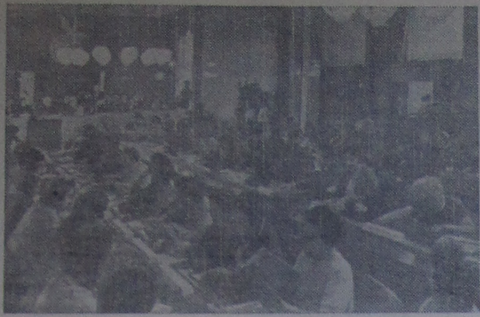
БЭ ДАНЕШТ. Сессия Совета Международной демократической федерации женщин. На снимке: в зале заседаний.