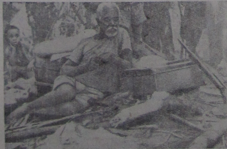
Португальские империалисты ведут колониальную истребительную войну против борющегося за свое освобождение народа Анголы. Упорное сопротивление, оказываемое ангольскими повстанцами, приводит в ярость португальских карателей. Они вымещают свои неудачи на мирном гражданском населении, расстреливая стариков, женщин и детей, сжигая дотла ангольские селения. На снимке: они бежали от зверств колонизаторов.