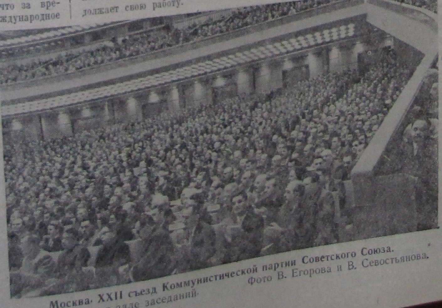
Москва: XXII съезд Коммунистической партии Советского Союза. На снимке: в зале заседаний.

Председательствующий на заседании тов. Ф. Р. Козлов предоставляет слово для отчетного доклада Центрального Комитета КПСС Первому секретарю ЦК КПСС тов. Н. С. Хрущеву. Делегаты и гости горячими аплодисментами встречают Никиту Сергеевича Хрущева. Все встают. Доклад тов. Н. С. Хрущева, продолжавшийся на утреннем и вечернем заседаниях, был выслушан с огромным вниманием и многократно прерывался бурными, продолжительными аплодисментами, одобрением всего зала. Председательствующий тов. Ф. Р. Козлов предоставляет слово для отчетного доклада Председателю Центральной Ревизионной Комиссии КПСС тов. А. Ф. Горкину. Докладом А. Ф. Горкина закончилось вечернее заседание съезда 17 октября. Съезд продолжает свою работу. (ТАСС).