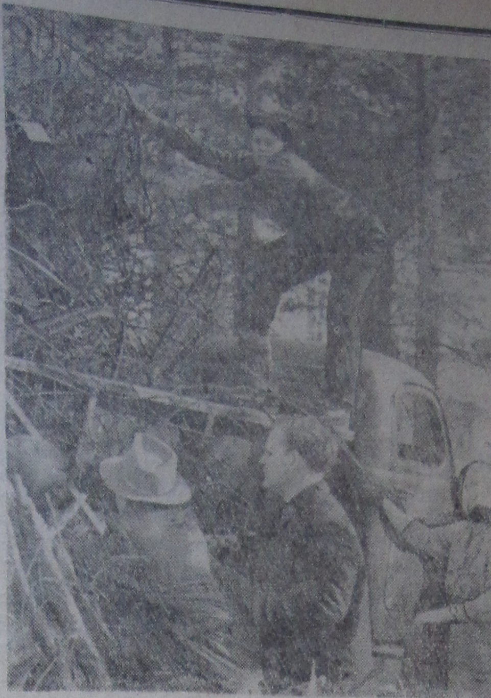
Коллектив Лаборатории ядерных проблем в честь съезда провел субботник.