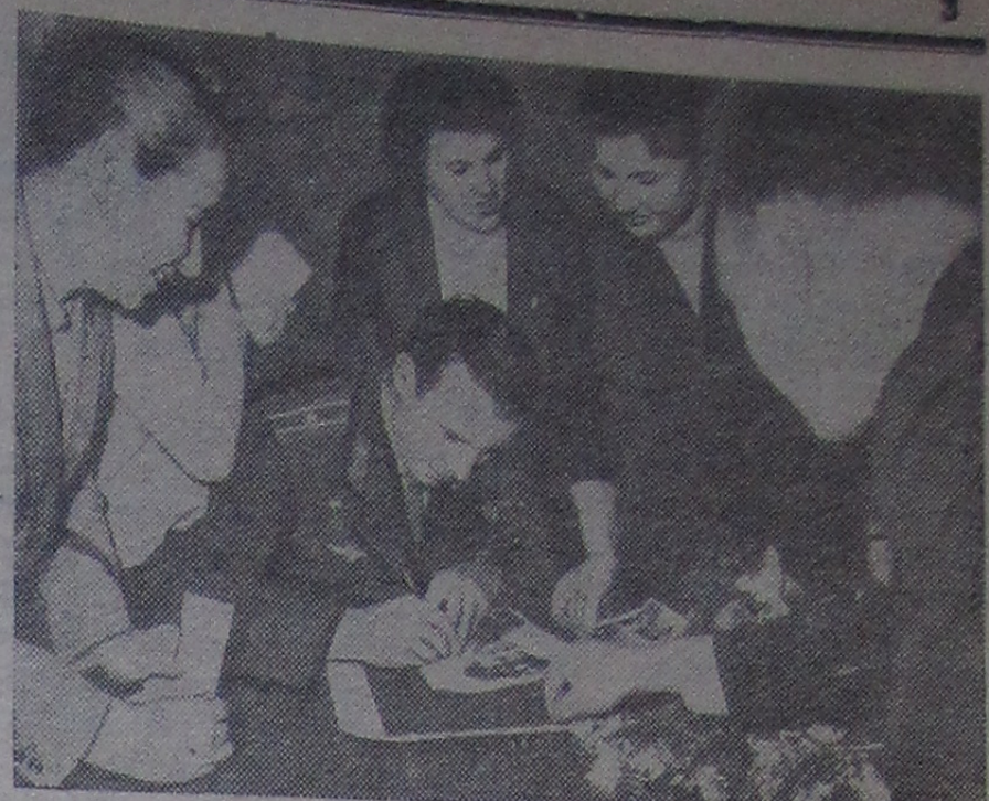
В Московском государственном университете имени М. В. Ломоносова состоялась вечер-встреча студентов и преподавателей МГУ с летчиком-космонавтом Юрием Гагариным. На вечеру советскому космонавту Ю. Гагарину были вручены диплом и Большая золотая медаль Международной авиационной федерации. На снимке: после встречи Ю. Гагарин подписывает автографы.