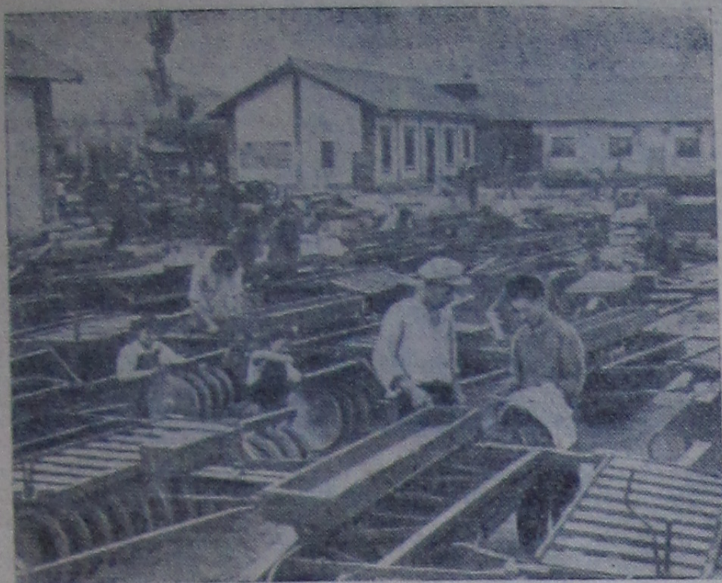
Физкультура и спорт