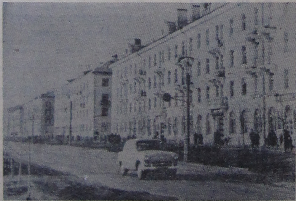
Красивыми многоэтажными домами украсилась за последние годы ул. Октябрьская (левобережье).

жителям левобережья. Закончилось строительство дорог в Юркино и Ратмино. Нынешней весной предусматриваются большие посадки деревьев, кустарников и цветов.