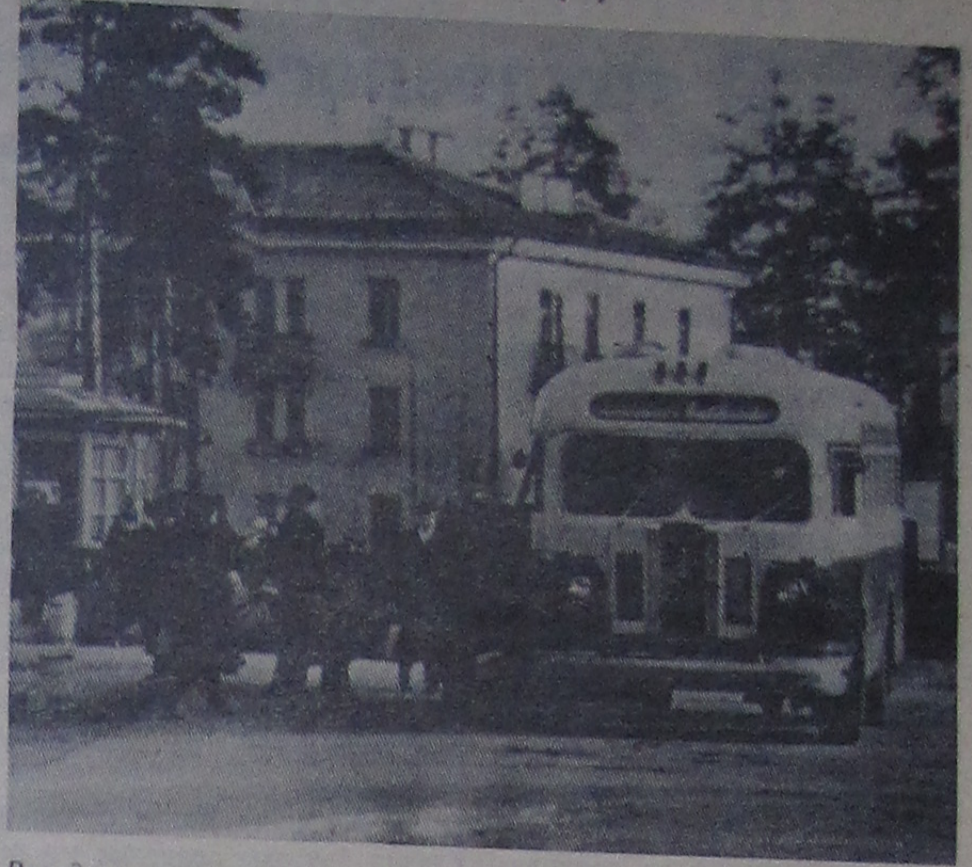
Всегда шумно и многолюдно на одной из красивейших площадей Дубны — площади Мира (правобережье).

На примере медицинского обслуживания населения нашего города видна забота партии и правительства о здоровье трудящихся.