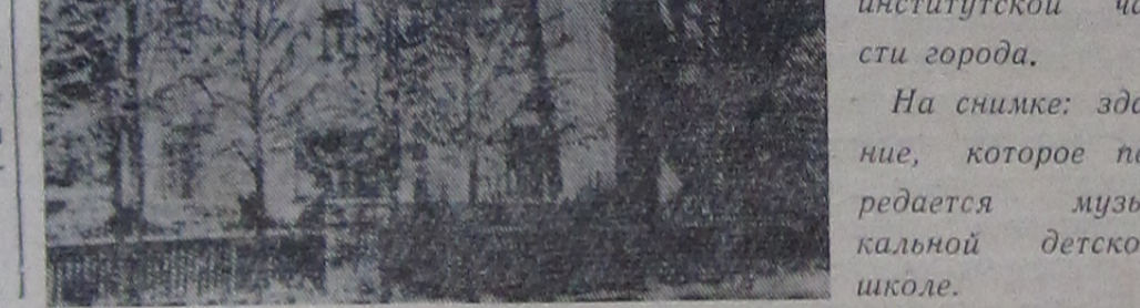
Хороший подарок получают юные музыканты институтской части города.

На снимке: здание, которое передается музыкальной детской школе.