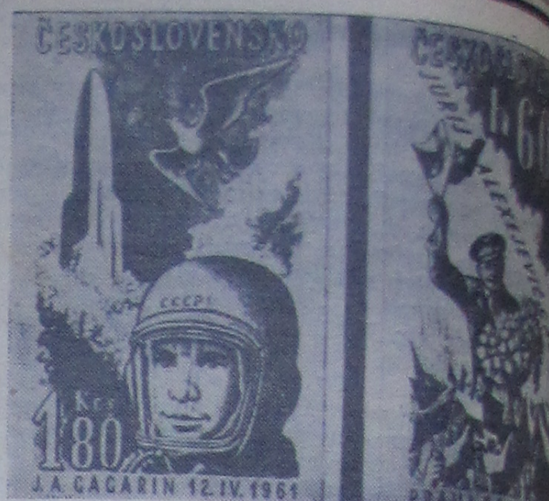
Две почтовые марки, посвященные первому в мире полету Ю. А. Гагарина, которые будут выпущены в ближайшем будущем Чехословацкой Социалистической Республике.

Первая программа 12.00 — Кинорепортаж о наших днях. 12.10 — Научно-популярные киноочерки «На ваш суд, товарищи» и «Настоящие друзья». 12.40 — Телевизионные новости. 18.15 — Телевизионные новости. 18.30 — Для дошкольников и младших школьников. «У нас в детском саду». 19.00 — «На полях страны». 19.20 — Польский художественный фильм «Орел». 20.50 — «Сегодня на форуме». 21.00 — Концерт из клуба «Форум». Передача из Центрального Дома литератора. 22.00 — Выступление комментатора по внешнеполитическим вопросам. 22.15 — Телевизионные новости.