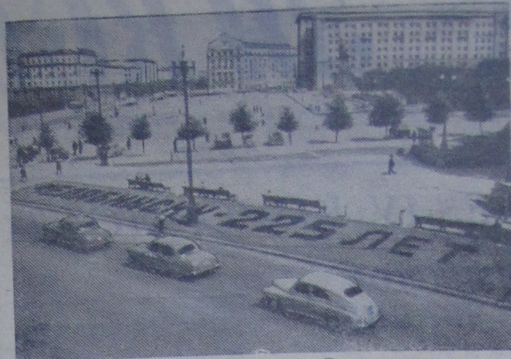
Челябинск. Площадь Революции.