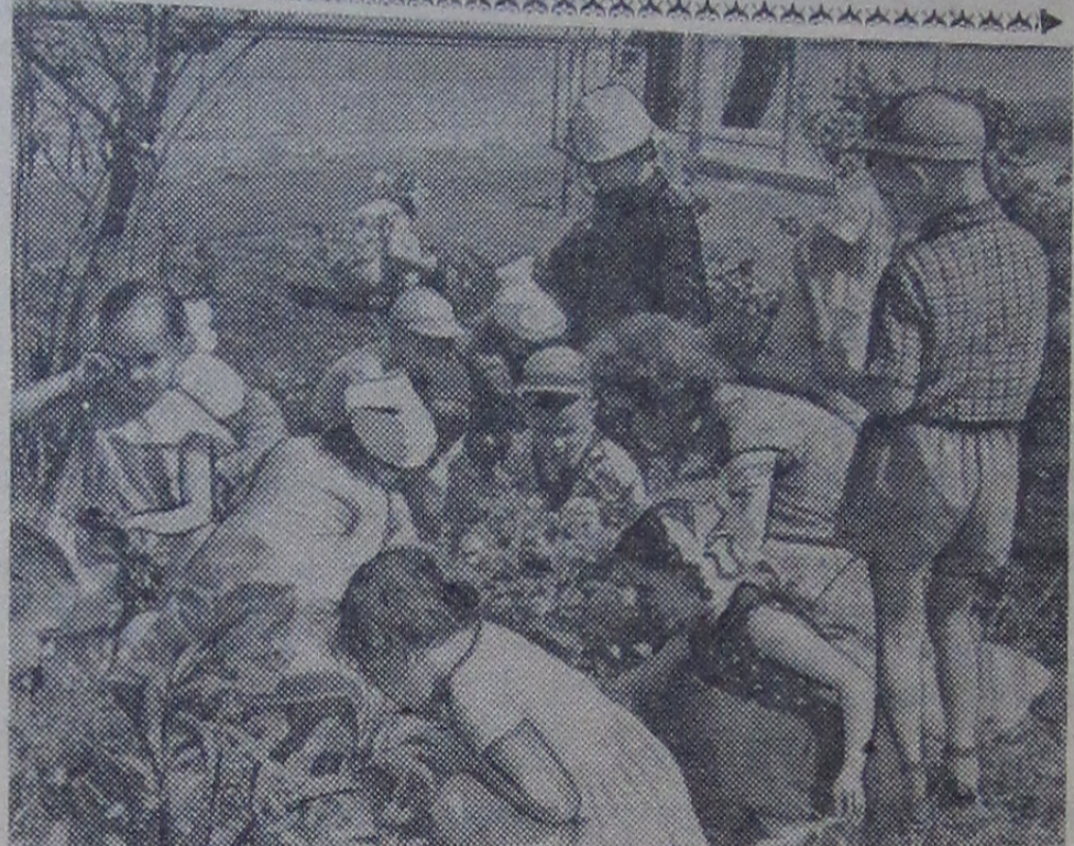
Детский сад № 9 (институтская часть города) открылся весной. Но его маленькие хозяева успели многое сделать вместе с воспи- тателями и родителями. Весной они посадили цветы, посадили огур- цы, морковь, горох, свеклу, бобы, салат, репу. А сейчас ребята кушают салаты, приготовленные из овощей со своего огорода. Вкусная была и клубника. На территории детсада растут яблони, на которых уже есть крупные яблоки, молодые кусты сирени, рябина, тополя, березы, много цветов. На снимке: прополка цветов.