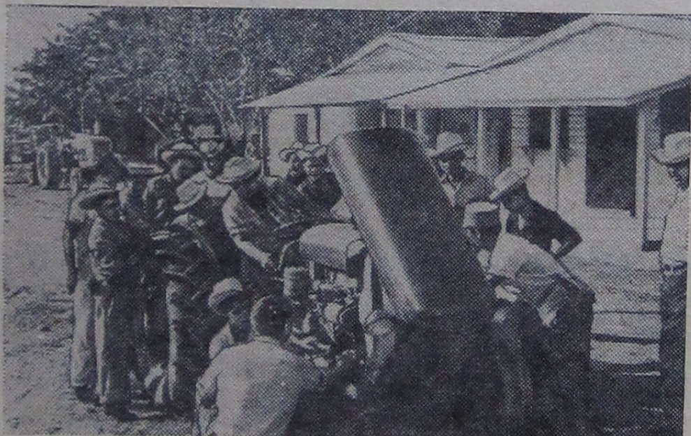
Кубинская Республика. В кооператив Сан-Франциско неподалеку от Монсанильо пришла техника.