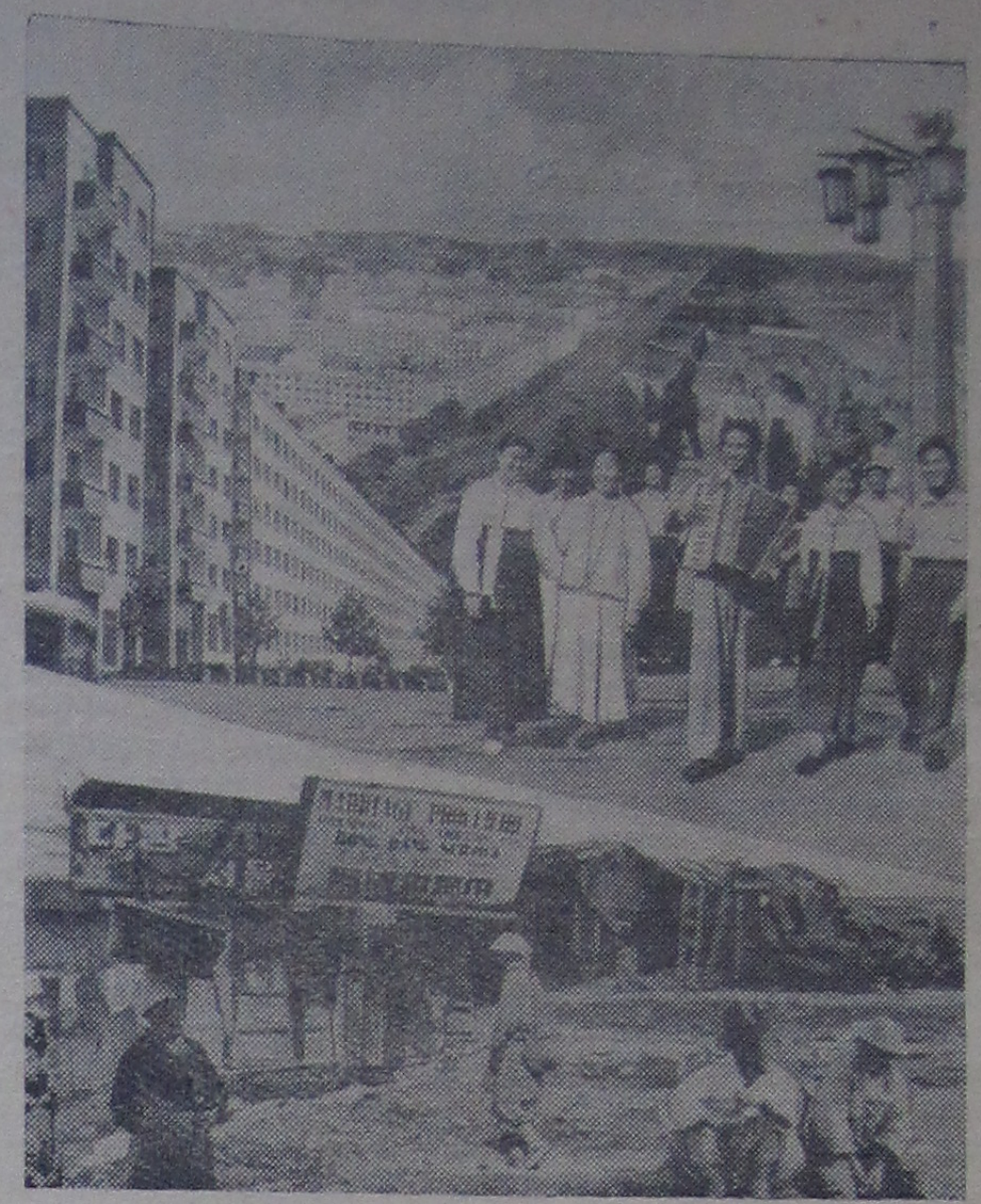
Верхний снимок — столица Северной Кореи город Пхеньян. Здесь корейскому народу свободно дышится, здесь песни слышатся. На нижнем снимке вы видите окраину города Сеула, столицу Южной Кореи. Здесь царят голод, нищета, безработица.