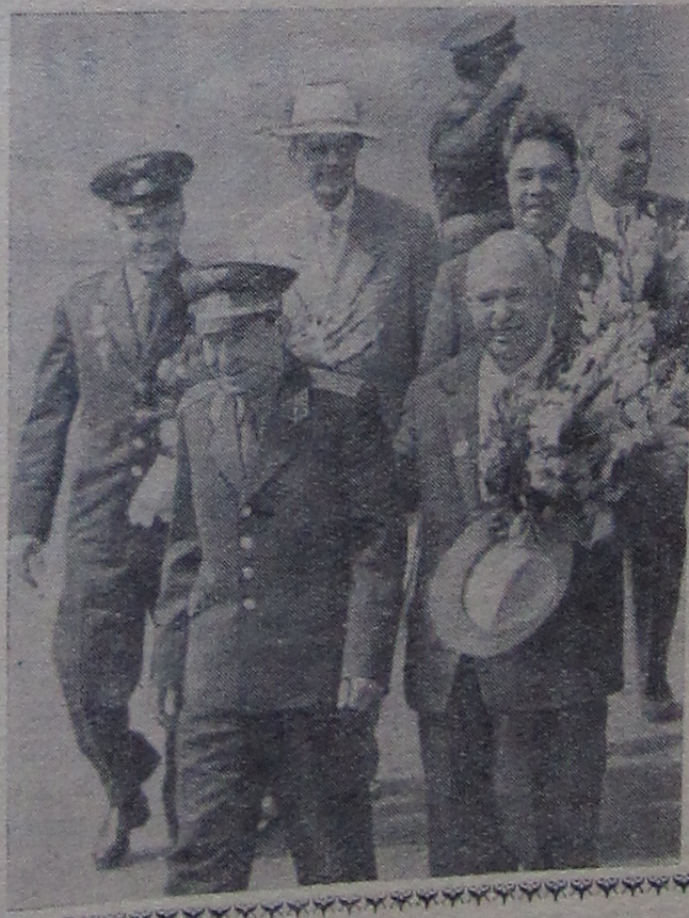
Москва. Торжественная встреча на Внуковском аэродроме сына советского народа героя космонавта майора Германа Степановича Титова.

Дорогие товарищи! Передаем вам и членам ваших семей самые искренние поздравления по случаю празднования годовщины Дня освобождения Кореи Советской Армией.