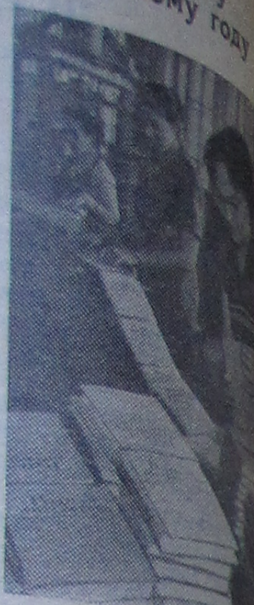
Минский полиграфический комбинат имени Якуба Коласа заканчивает выпуск 30 миллионов экземпляров учебников для школьников к новому учебному году.