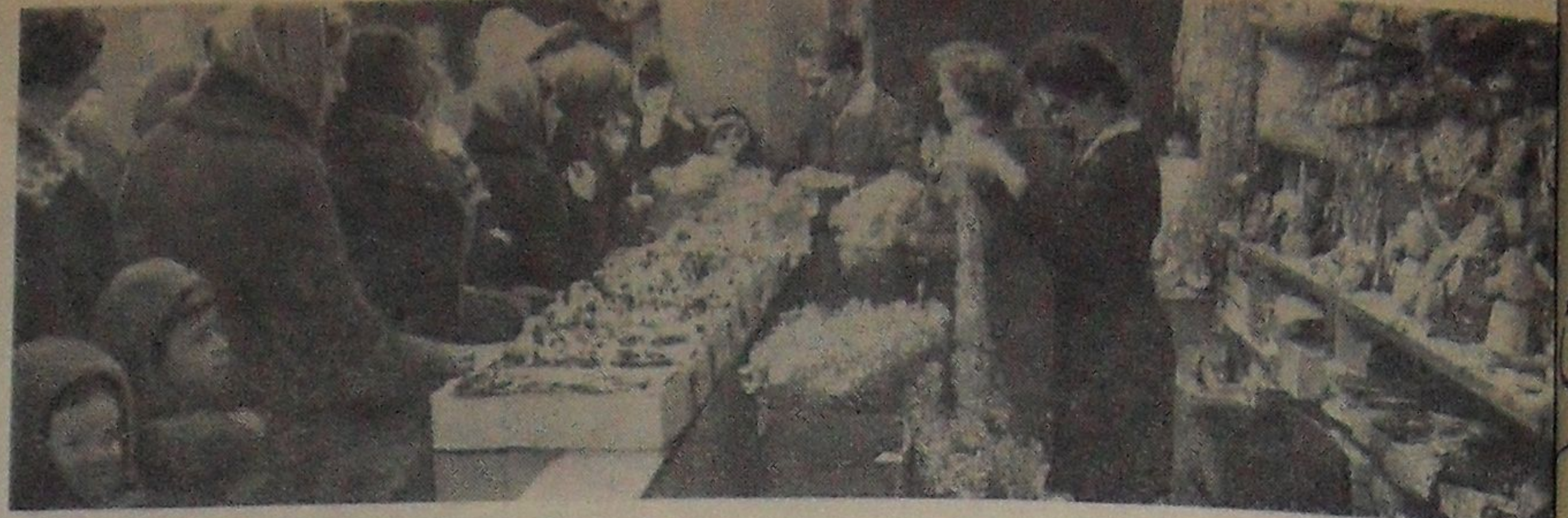
Скоро в каждый дом постучится Новый год! Много традиционных дедов морозов появилось на прилавках магазинов и каждый из них непременно займет свое место у празднично украшенных полок. На снимке: торговля елочными игрушками в магазине № 16 орс институтской части города.

Дубненская типография отдела издательства и полиграфической промышленности Московского областного Управления культуры. заказ 3214.