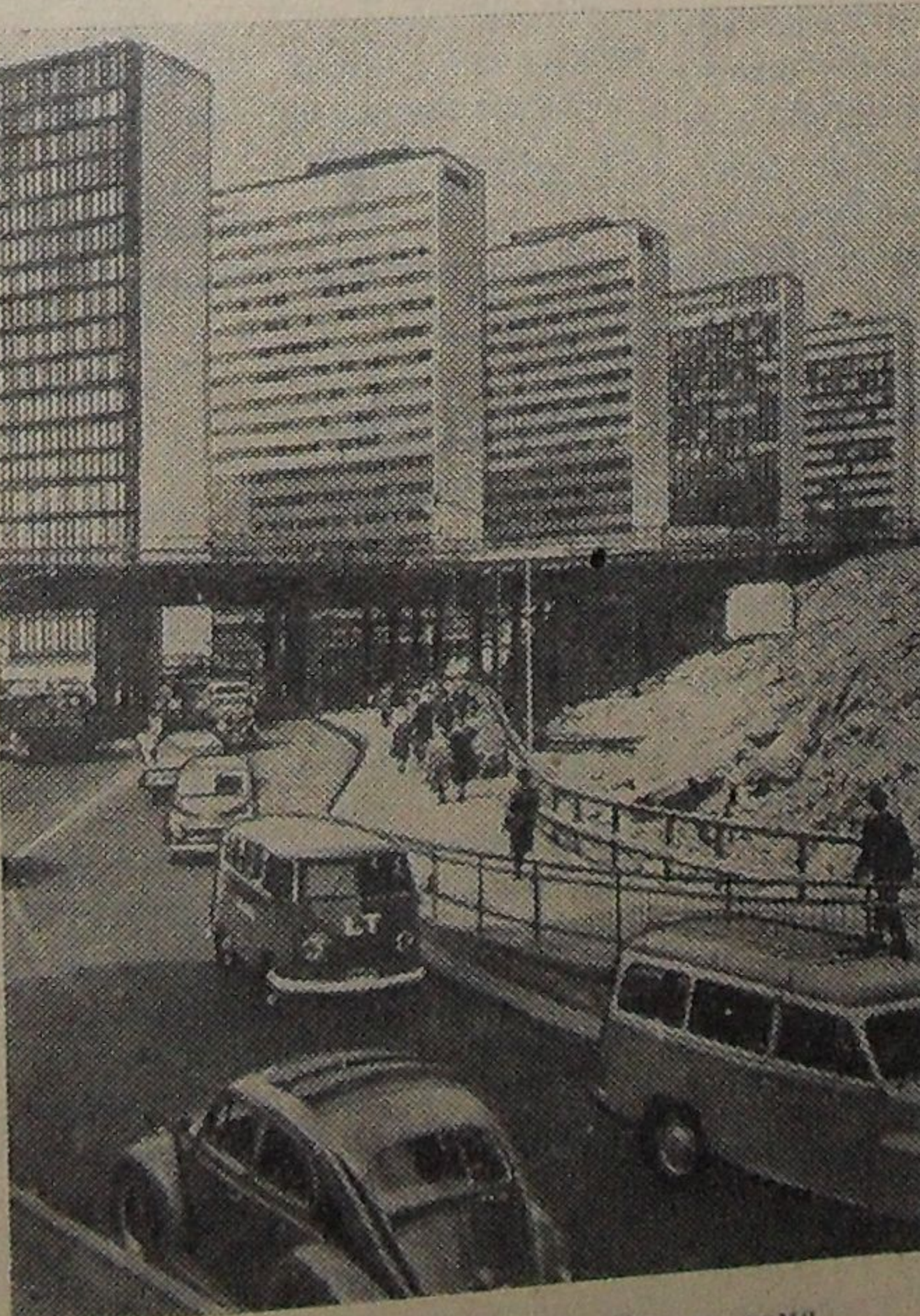
Столица Швеции Стокгольм. Новые дома.

Скандинавы готовятся встретить Н. С. Хрущева.