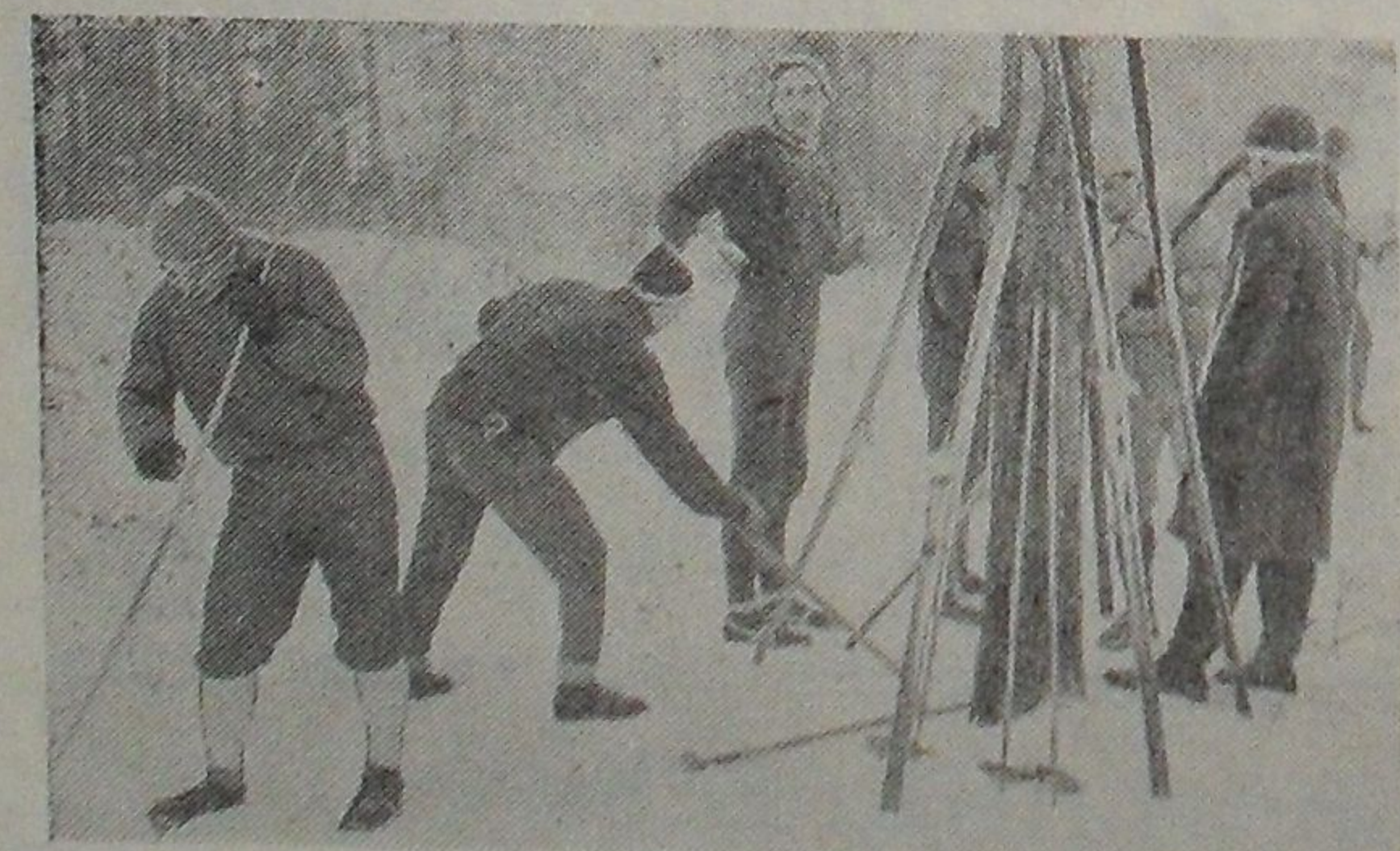
Перед соревнованиями на приз газеты «За коммунизм».