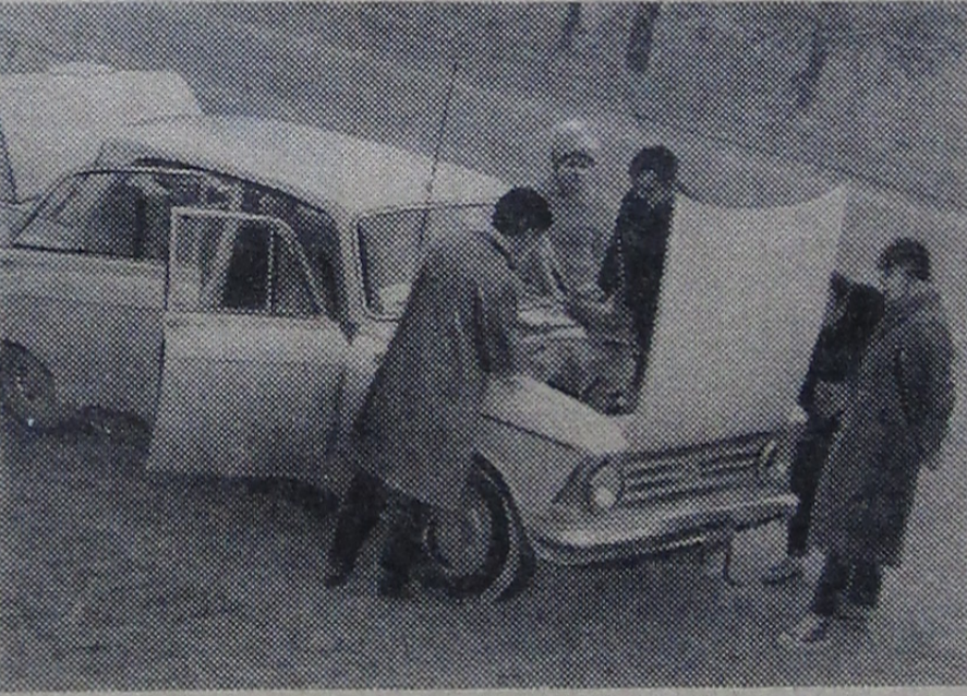
На снимках: Мы в Минске. «Москвич-408» испортился.