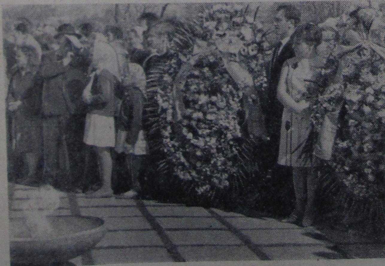
Возложение венков к памятнику героям Брестской крепости.

Но вот, встал наш «Москвич-408». Оказалось, что требуется сложный ремонт в условиях станции техобслуживания, а до самой ближайшей — 70 км. По маршруту остановка на ночлег должна быть в городе Столбцы Минской области, до которого около 200 км. При буксировке не доехать. И тогда принимаем решение: часть колонны, в основном быстродвижные машины, остается для помощи, а остальные идут на Борисов, чтобы устрониться на ночлег.