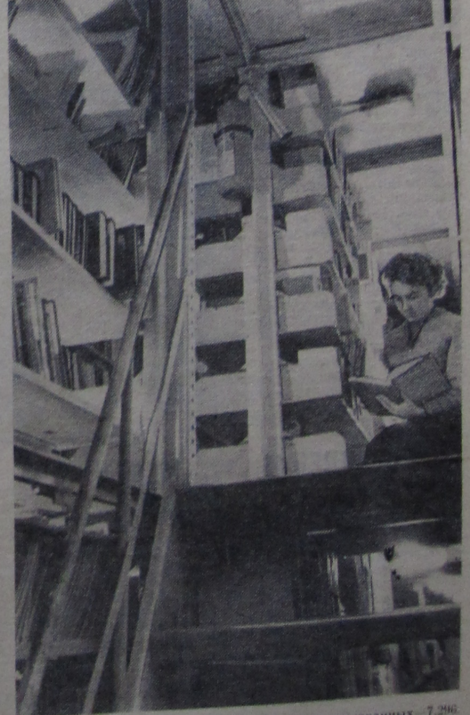
поступило 16.914 печатных единиц, из них иностранных — 7.296. Библиотека получала газеты и журналы (342 названия). В порядке бесплатного поступления по обмену получено около 3.000 печатных единиц.

В 1965 году библиотека обслужила 3402 читателя, в том числе прибывших в командировку 395 человек. Количество читателей возросло на 211 человек по сравнению с 1964 годом.