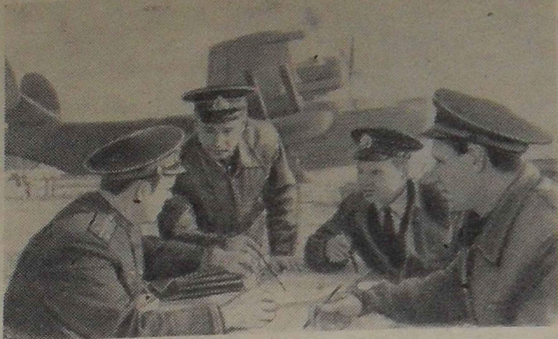
Предстоит длительный полет. Штурманы экипажей уточняют данные прогноза погоды.

Среди праздников Советской страны День Воздушного Флота — один из самых любимых. В этот день советские люди славят труд ученых и конструкторов, рабочих и инженеров отечественной авиационной индустрии, летное мастерство покорителей высоты и скорости, тех, кто крепит экономическую и оборонную мощь своей строящей коммунизм Родины.