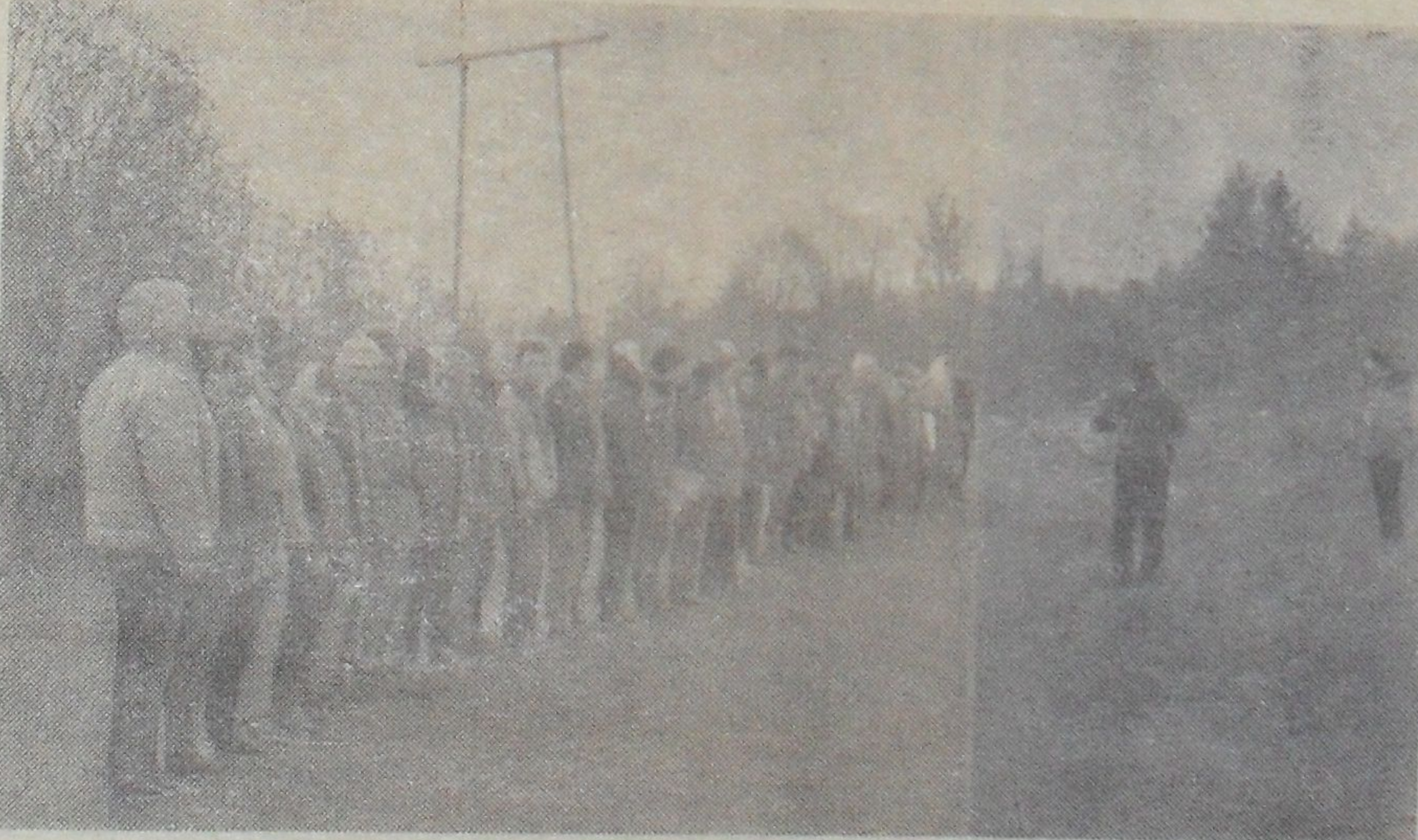
Общее построение участников слета

Летний туристский сезон закрыт, впереди туристская зима, подготовка к новым походам, преодоление новых рубежей.