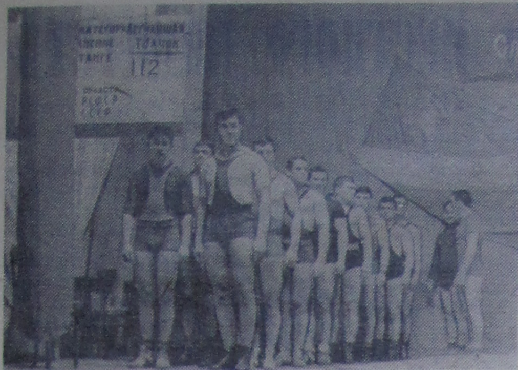
Дубненские штангисты на торжественном открытии соревнований.

Традиционными соревнованиями на кубок Московской области завершили штангисты Дубны 1968 год. В самом конце декабря в Можайске состоялся финал наиболее популярного в Подмоскovie соревнования силачей.