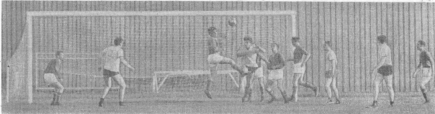
Два матча между сборной командой землячеств стран-участниц и командой ветеранов дубненского футбола вызвали интерес у любителей спорта. Игры протекали остро, с боевым накалом и результатами были неожиданными.

Несмотря на опытность и высокую технику дубненской команды любители футбола из разных стран сводили счет к минимальному. Так, первая игра закончилась со счетом 3:3, а вторая — 2:1 в пользу ветеранов.