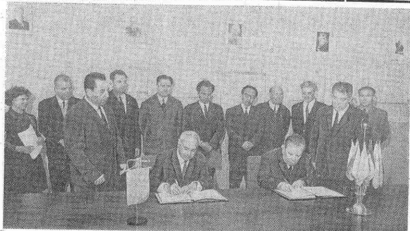
18 июня в Дубне был подписан чрезвычайно важный документ, определявший новый этап в развитии сотрудничества Объединенного института ядерных исследований как международного научного центра социалистических стран с институтами Государственного комитета по использованию атомной энергии СССР. — Соглашение о научно-техническом сотрудничестве.

Бюро ГК КПСС и исполком городского Совета отметили хорошую работу коллективов завода железобетонных изделий и деревянных конструкций, автотранспортного предприятия «Дубна», газоприемораздаточной станции и СТОА по выполнению плановых заданий II квартала 1970 года.