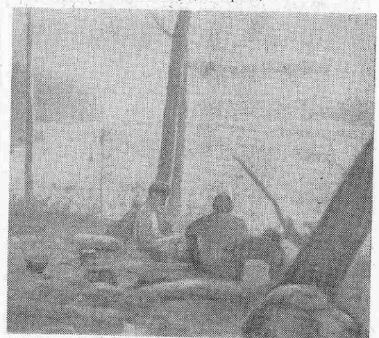
Остановка у надежды.

Пейзаж уже не тот, что был наверху: сопки более пологие, долина Юдомы значительно расширилась, лес существенно гуще и выше. Начала попадаться береза — выше ее не было. Несколько раз спускаем выводки уток и гусей. Время от времени проходим мимо целых плантаций деревьев и кустарников, висящих над водой, под небольшим слоем мха и черной земли просматриваются бесцветные массы — это замерзшая вода. Не следует забывать, что находимся в краю вечной мерзлоты.