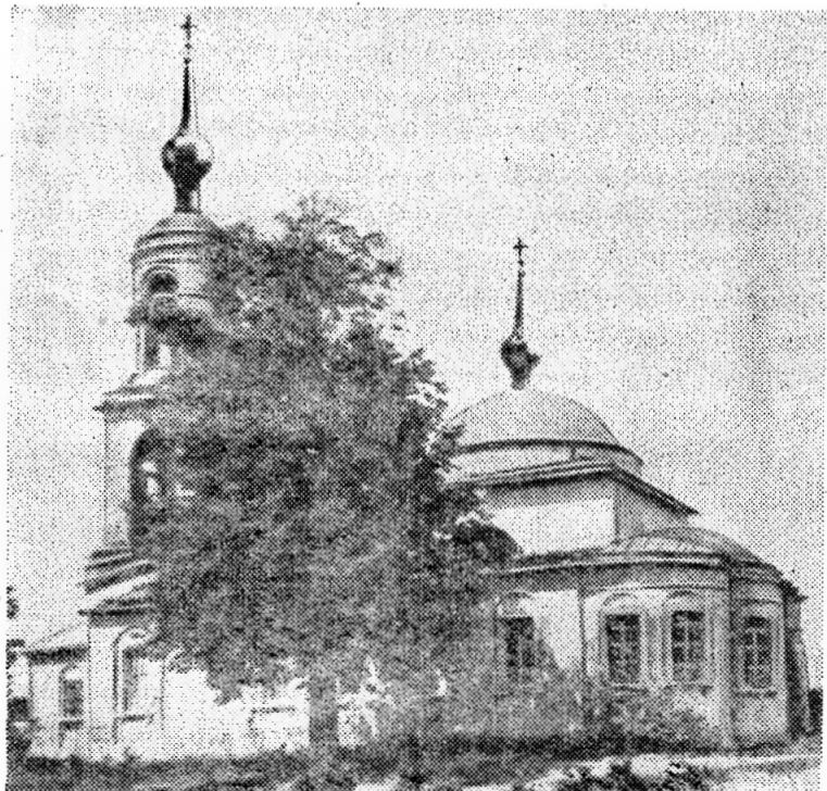
Городищенская на Дубне церковь.