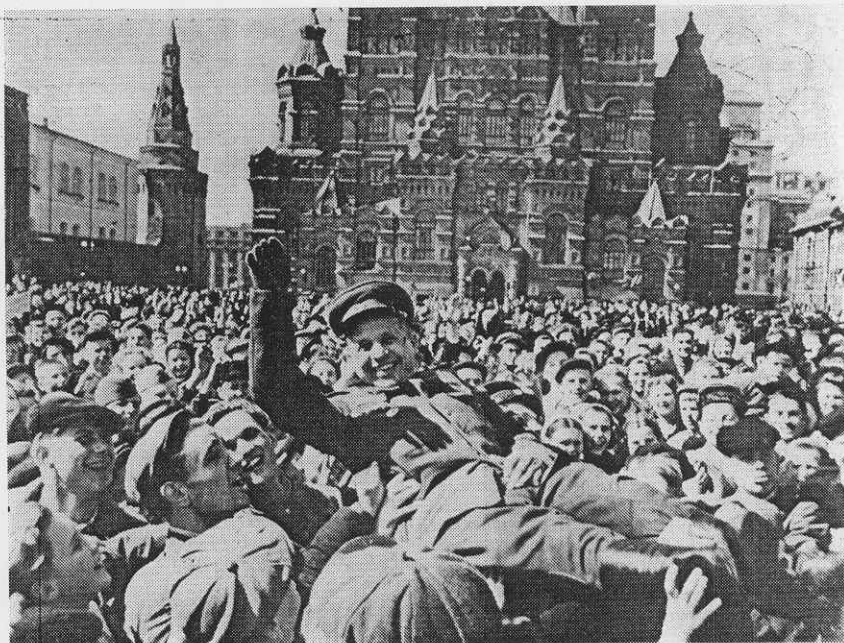
МОСКВА. КРАСНАЯ ПЛОЩАДЬ. 9 МАЯ 1945 ГОДА.

В канун 40-летия Победы мы, участники Великой Отечественной войны, обращаемся к молодежи ОИЯИ с призывом плодотворно трудиться, постоянно учиться и совершенствовать свое профессиональное мастерство, совершенствоваться духовно и физически, сохранять и приумножать славные традиции старших поколений, отдавать все свои силы борьбе за дело коммунизма, сделать все для предотвращения новой войны.