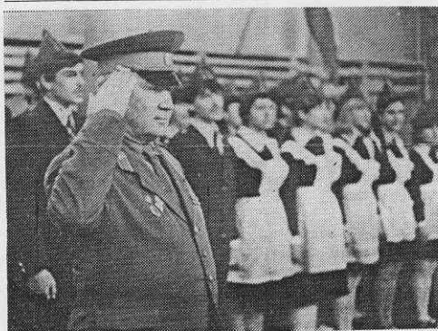
РАПОРТ ПРИНИМАЕТ ВЕТЕРАН. Смотр строя и песни в школе № 9.