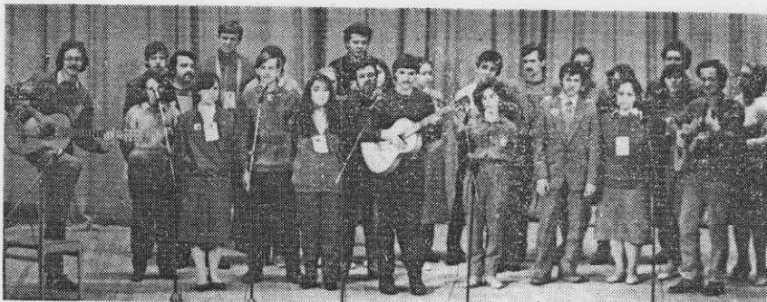
Заключительные аккорды фестиваля.