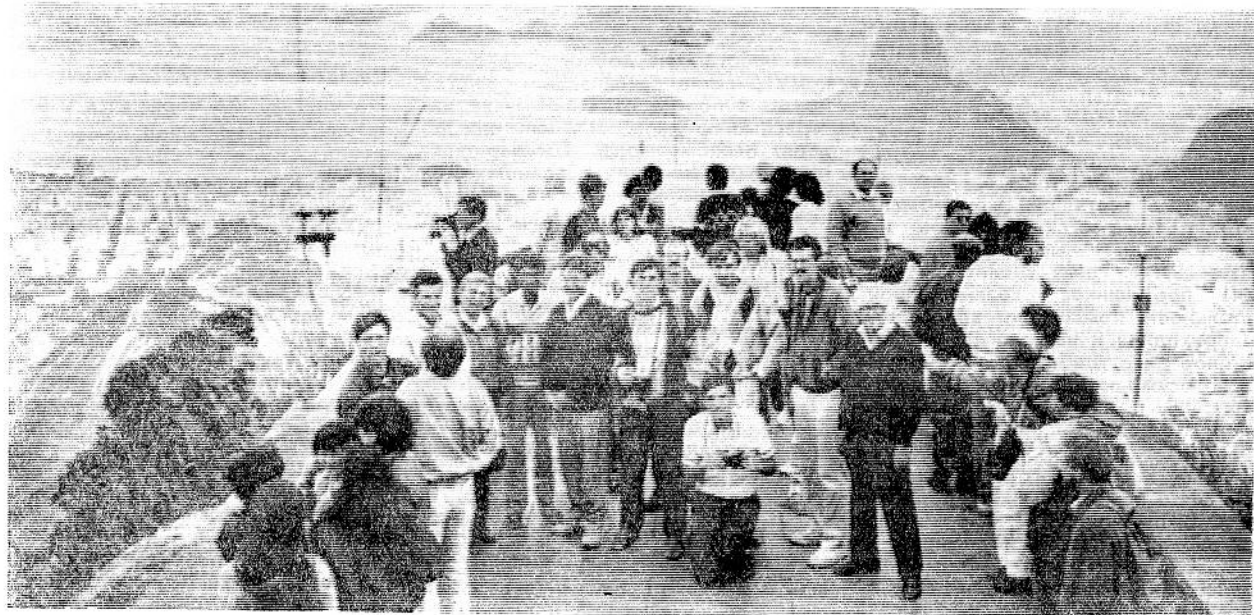
Участники школы в Рио-де-Жанейро.