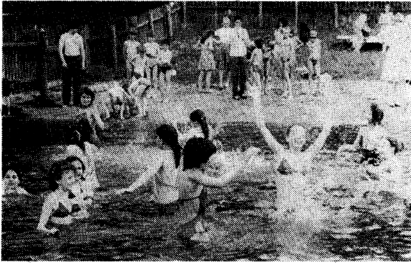
Окончание. Начало на 6-й стр.

щим (вернее, умеющим зарабатывать) валюту полагаются небольшие привилегии, для них работает кафе «У папы Карло» после отбоя, а можно и видик ночью посмотреть. Валюта есть валюта! Сами понимаете.