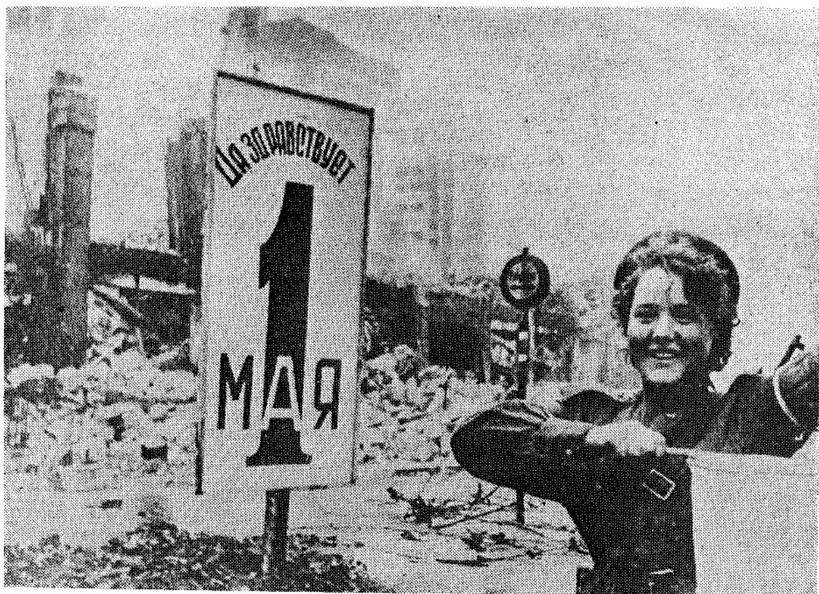
НА БЕРЛИНСКОМ ПЕРЕКРЕСТКЕ