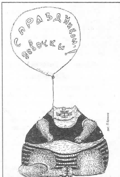
рис. П. Климов

Скажите, трудно руководить женским коллективом?