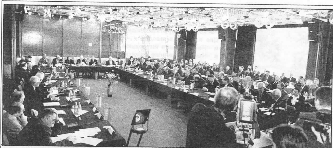
Участники и гости сессии в зале заседаний ДМС.

федеральной целевой программы развития Дубны как наукограда. ОИЯИ будет самостоятельно определять приоритетные направления своей деятельности, которые могут быть включены в программу развития Дубны как наукограда. Особый правовой статус ОИЯИ как международной межправительственной организации, его привилегии и иммунитеты Соглашением не затрагиваются. Участие в этой программе не требует от Института и стран-участниц никаких дополнительных финансовых средств, но предполагает дополнительные финансовые вливания и налоговые льготы от муниципальных, областных и федеральных властей, в том числе на реализацию мероприятий по развитию инфраструктуры города, созданию благоприятных условий для жизни и творчества ученых.